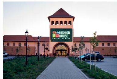
FASHION HOUSE Outlet Centre Bucharest, West Park