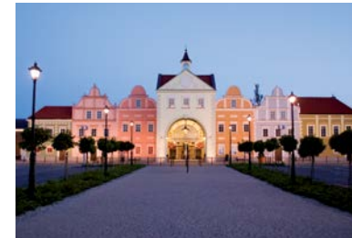
FASHION HOUSE Outlet Centre Warsaw