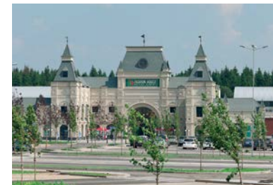
FASHION HOUSE Outlet Centre Moscow