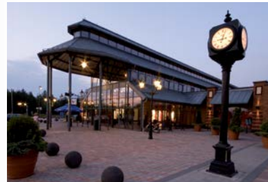
FASHION HOUSE Outlet Centre Sosnowiec