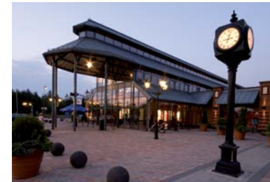
FASHION HOUSE Outlet Centre Sosnowiec