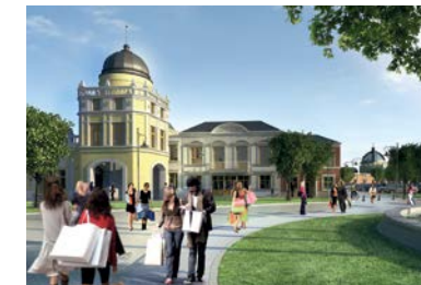
FASHION HOUSE Outlet Centre Bucharest, Cernika Park