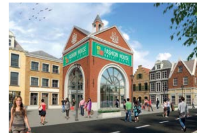
FASHION HOUSE Outlet Centre Saint Petersburg