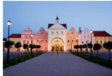
FASHION HOUSE Outlet Centre Warsaw

FASHION HOUSE Group tel: +48 22 571 44 44 info@fashionhouse.com www.fashionhouse.com www.fashionhouse.ro