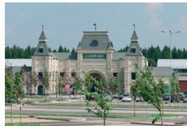
FASHION HOUSE Outlet Centre Moscow