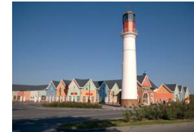
FASHION HOUSE Outlet Centre Gdańsk