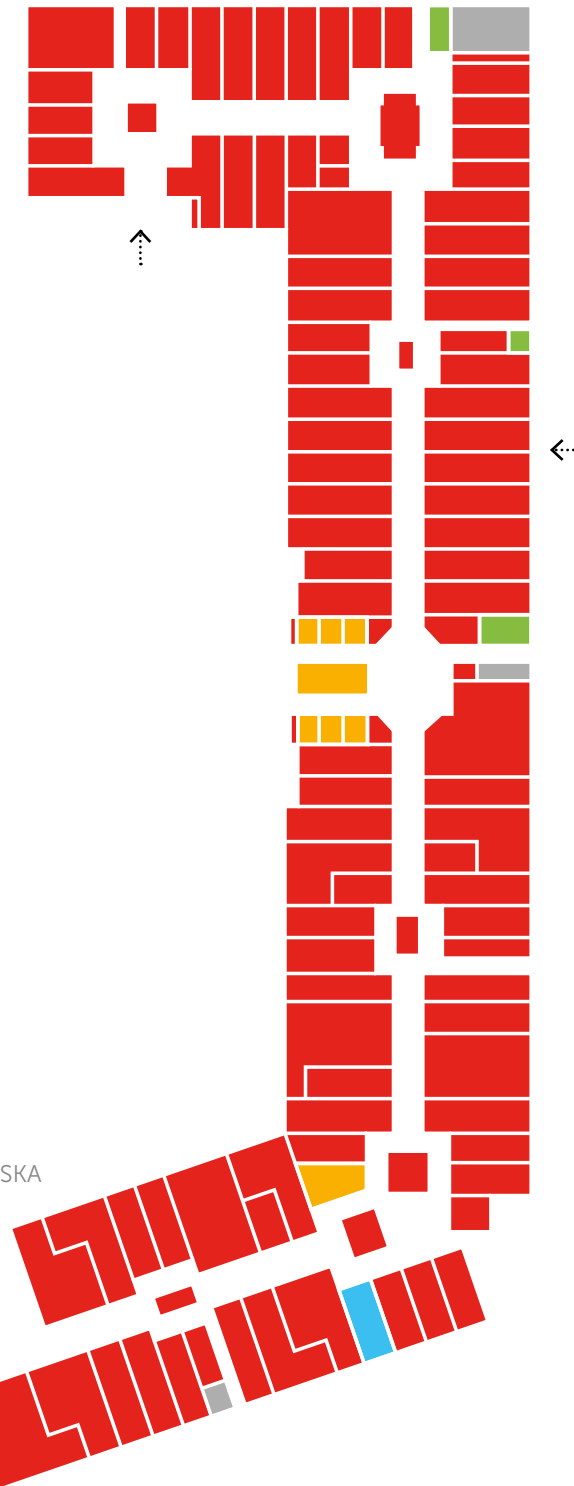
LIGHTHOUSE LATARNIA MORSKA