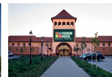
FASHION HOUSE Outlet Centre Bucharest, West Park