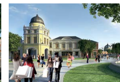
FASHION HOUSE Outlet Centre Bucharest, Cernica Park