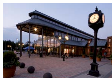
FASHION HOUSE Outlet Centre Sosnowiec

PEAKSIDE Polonia Management Sp. z o.o. al. Jana Pawła II 29, 00-867 Warsaw T: +48 22 653 69 00