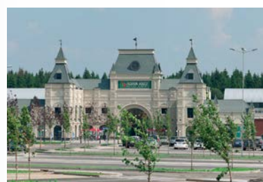
FASHION HOUSE Outlet Centre Moscow