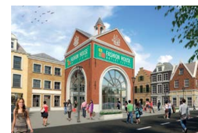
FASHION HOUSE Outlet Centre Saint Petersburg