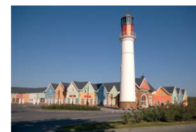
FASHION HOUSE Outlet Centre Gdańsk